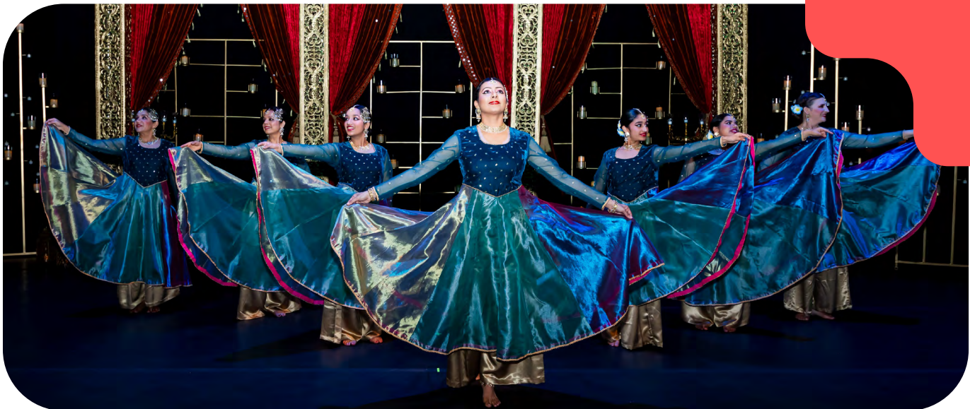
Kathak Dance Collective, 'Satrangi re...Shades of Love' (2024). Wortham Center, Houston, TX.

HAA alienta a todos los solicitantes y beneficiarios a mantenerse en contacto con HAA para discutir el alcance del trabajo y preocupaciones presupuestarias. HAA está aquí para ayudar a resolver ideas y verificar si cualquier cambio en el alcance del trabajo entra en conflicto con los contratos de los beneficiarios o estas guías. Puede compartir información, hacer preguntas o solicitar una reunión en cualquier momento a través del Support Desk .