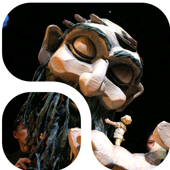
The Puppet & Its Double Theater, 'The Selfish Giant' (2024). Asia Society Texas Center, Houston, TX.

Todos los solicitantes aceptan los siguientes procesos y estructuras de otorgamiento de becas al solicitar. Los detalles específicos de cada programa de becas siguen a esta sección.