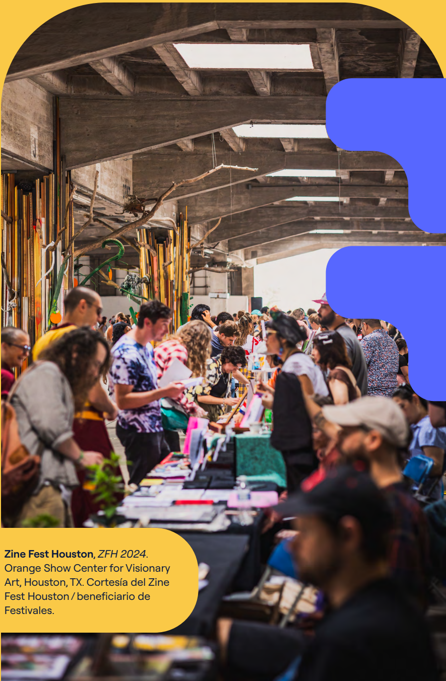
Zine Fest Houston, ZFH 2024. Orange Show Center for Visionary Art, Houston, TX.