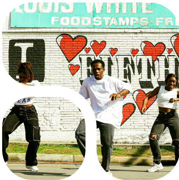
I Love The Nickel Community Block Party (2024). Louis White Grocery, Houston, TX. En la imagen: artistas del festival.