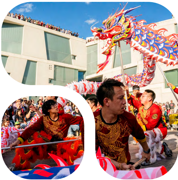
Lee's Golden Dragon Lion and Dragon Dance Association, Winter Festival Lunar New Year (2024). Museum of Fine Arts, Houston, Houston, TX.

Durante el ciclo de becas, se requiere un evento en persona o una presentación virtual en vivo. Los eventos en persona deben estar abiertos al público general, teniendo lugar dentro de los límites de Houston. El solicitante debe identificar el espacio en persona públicamente accesible o evento virtual en vivo en su solicitud.